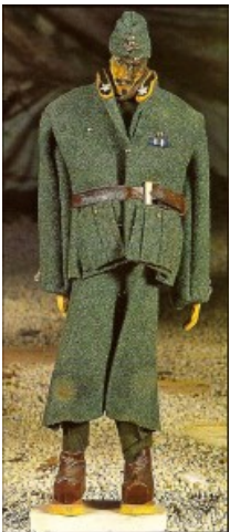
Presepio di Wietzendorf:

La nostalgia per la propria terra spinse il giovane professore di disegno ad ambientare la scena in un angolo d’una tipica cascina della Bassa, dove un’umile contadina nel costume lombardo s’avvicina al Bambin Gesù, stretto tra le braccia della Vergine Maria che lo offre per la redenzione dell’umanità. Attorno ci sono i re magi, la tessitrice che confeziona la «vituperata» bandiera tricolore, lo zampognaro abruzzese e il pastore calabro, presenze poetiche del presepe, e «rappresentanti» degli sventurati compagni di prigionia.