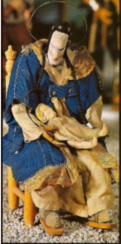
Presepio di Wietzendorf: la Madonna col Bambino

Ma leggiamo la sua storia: “Battaglia lavorò attorno a un’idea del tutto nuova, in modo da rappresentare l’umana varietà rinchiusa nel lager tedesco, cercando di ricordare a ciascuno almeno un segno della propria casa lontana. Così, con un coltellino scout (miracolosamente scampato a ogni perquisizione), una forbicina robusta, un cardine di una porta come martello, alla luce di un lumino che ognuno contribuì ad alimentare togliendo una piccola parte alla microscopica razione giornaliera di margarina, nacque questa sacra rappresentazione.